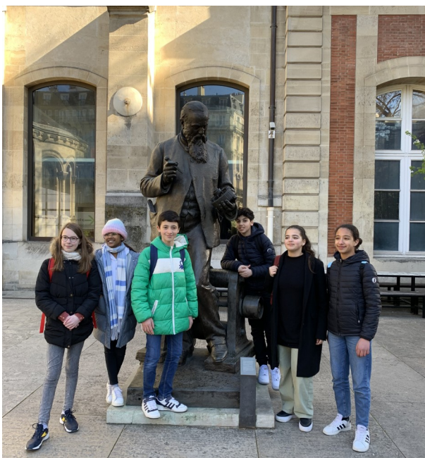
Devant le musée des arts et métiers