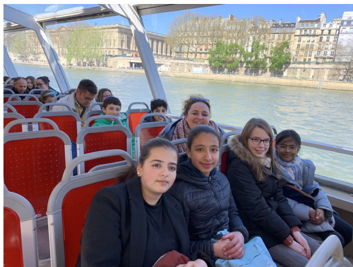
Croisière sur la Seine