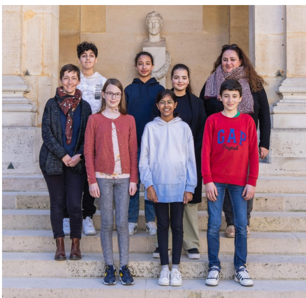
A l'académie des sciences