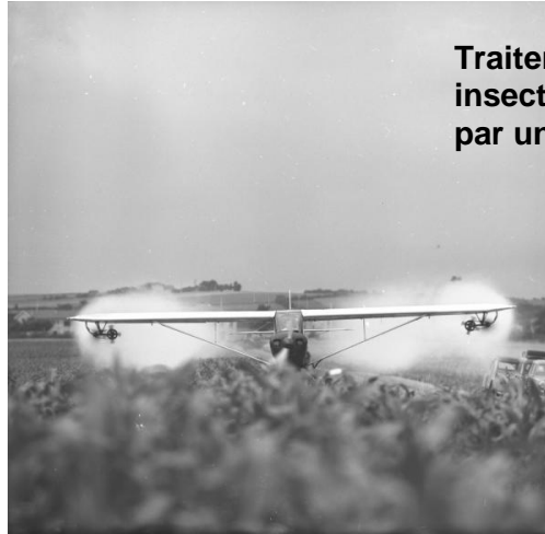
Traitement des cultures avec des insecticides à base de DDT répandu par un avion.

En 1970, le gouvernement français a strictement interdit l'usage de l'insecticide DDT.