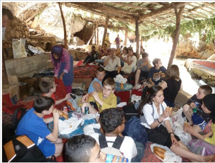
Le pique nique au frais