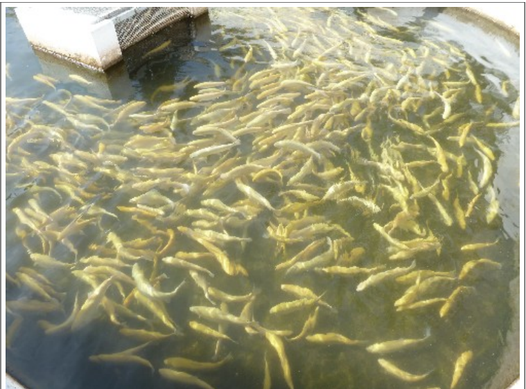
Des truites dorées

Ensuite nous sommes rentrés au centre d'accueil où nous avons travaillé pour compléter ce qui manquait sur le livret.