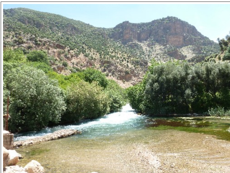
L'arrivée près des sources

En milieu de matinée nous sommes partis aux sources d' Oum Rabia avec 7 élèves du collège Al Atlas.