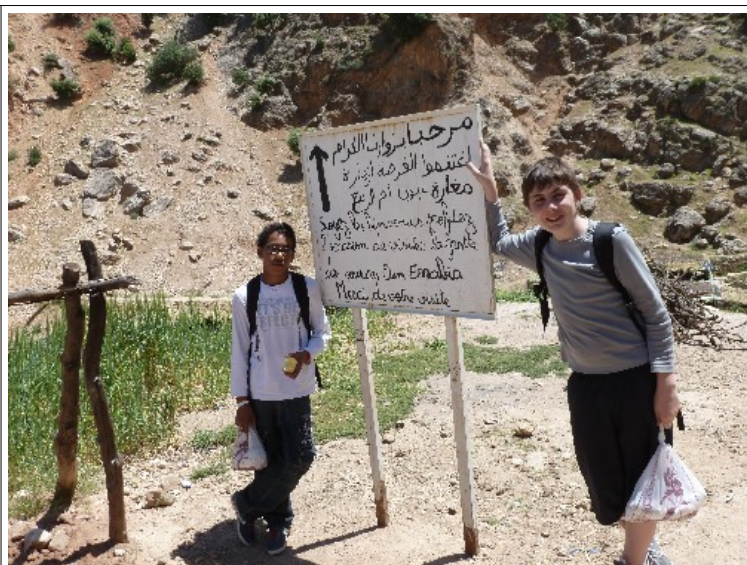
Sur le chemin