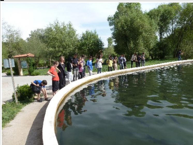
A la pisciculture

En repartant nous avons visité la plus grande pisciculture d'Afrique à Azrou. Ils y élèvent des truites et leur permettent de se reproduire plus vite.