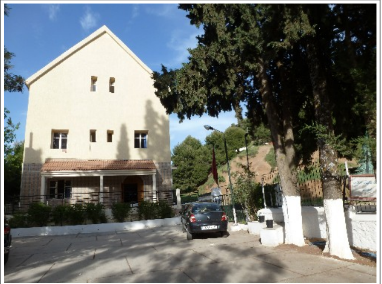
Le centre d'accueil