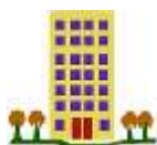
flat / apartment